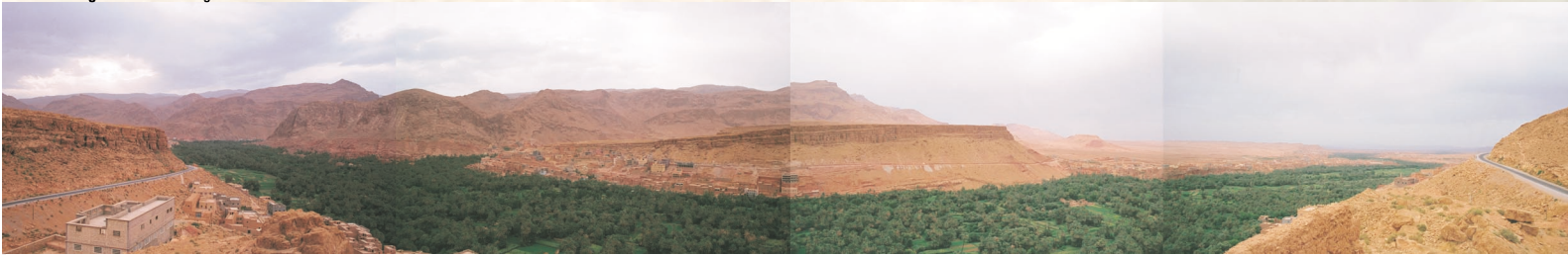
Valle del Todgha / Vallée du Todgha

El paisaje reseco del Gran Sur sólo es contrastado por el paso de numerosos oasis longitudinales: el Draâ, el Dades, el Todgha, el Gheris y el Ziz. Se hunden en la Hammada hasta desaparecer en el desierto de arena.