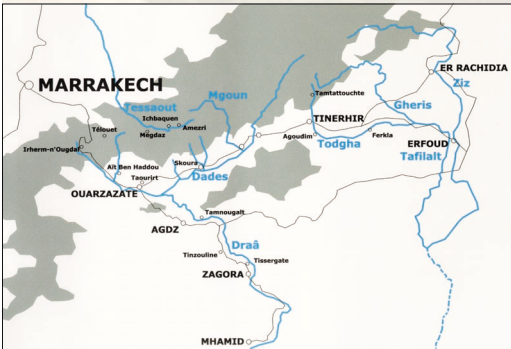
Valle del Draâ / Vallée du Draâ