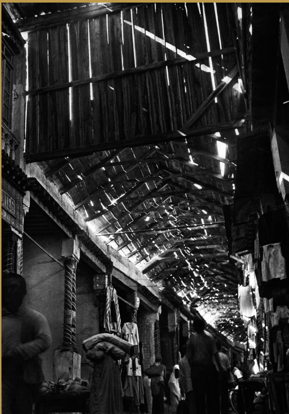
Le Souq, Tunis. 1930.

Situé autour de la Grande Mosquée, le souk de Tunis continue à préserver la vitalité d'autres époques et constitue un véritable centre commercial sur son emplacement original. Bien que sa trame orthogonale ordonne parfaitement les espaces, pour ceux qui y pénètrent pour la première fois il devient un véritable labyrinthe, où la seule référence est la différence des marchandises. La photographie, qui date des années trente, permet d'observer la magnifique structure de bois qui filtre la lumière, ainsi