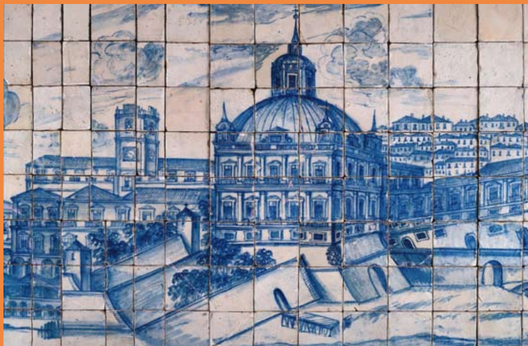
“Terreiro do Paço”, parte del panel de azulejos “Grande Ponorama de Lisboa antes do Terremoto”. Circa. 1700. Museo Nacional do Azulejo de Lisboa, Portugal.

El Museo Nacional do Azulejo posee en su colección permanente un panel de azulejos de gran valor histórico, cultural y artístico, que representa la ciudad de Lisboa antes de haber sido destruida por el terremoto de 1755. En esta “Vista de Lisboa” están pintados los monumentos (iglesias, conventos, palacios), edificios públicos (la Alfândega, la Casa da India, el Arsenal), los espacios públicos relacionados con la vida social y económica (el Terreiro