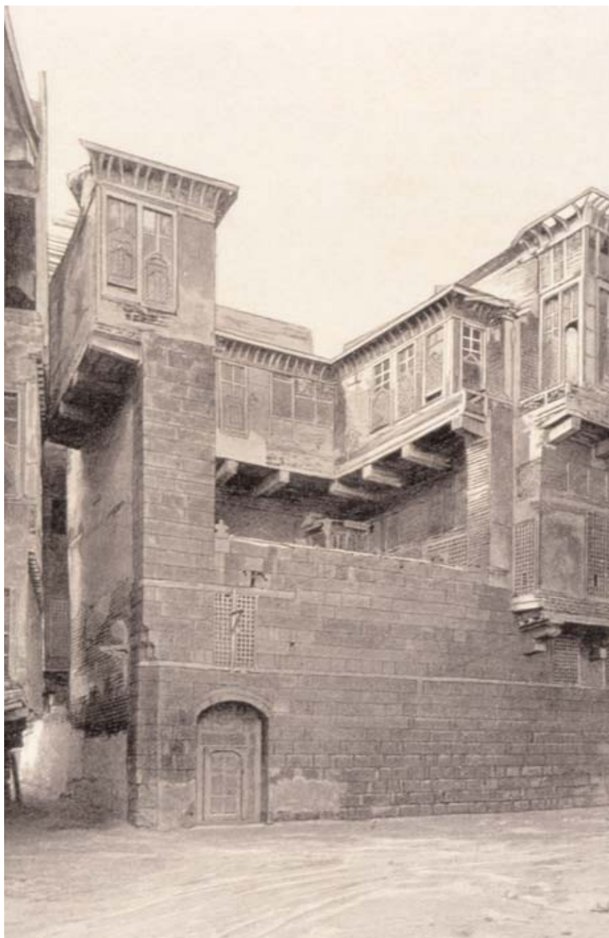
Palais du XIV e siècle à Damiette (Égypte) dessiné par Mignon avec un niveau de précision quasi photographique dans les détails. Ce dessin a été publié en 1904 dans Le Tour du Monde , Hachette, Paris.

« Et c'est bien une vision de la ville morte que ces rues tournantes, bordées de vieux palais ; une vision calme, apaisée, comme une projection d'un temps lointain qui s'efface ». Ce commentaire sur la ville de Damiette, écrit par le grand égyptologue Albert Gayet (1856-1916), fait partie de l'article « Coins d'Égypte ignorés » publié en mai 1904 par la revue Le Tour du Monde . Gayet, outre l'introduction à l'histoire de cette ville, décrit en détail un grand nombre de ses bâtiments, les riches matériaux utilisés et même certaines des solutions constructives, en intervenant toujours sur la valeur de ces constructions et en critiquant leur état d'abandon. Cet article a été illustré par différents artistes de l'époque, parmi lesquels figure Mignon, auteur du dessin publié, et il constitue un document de base qui nous permet de découvrir des édifices aujourd'hui disparus.