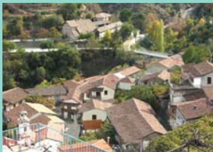
Un photomontage présente le quartier ancien de Kalopanagiotis après le projet de réhabilitation.

La petite ville chypriote de Kalopanagiotis, située dans le massif montagneux de Troodos, veut récupérer son caractère original et son attrait touristique grâce à un projet de réhabilitation de son patrimoine d'architecture traditionnelle et de son paysage. Le projet, grâce à un investissement de deux millions d'euros financé conjointement par l'Union européenne, l'État chypriote et la municipalité, commencera au cours du premier semestre de cette année 2005 et il prendra fin en 2008. Le responsable du projet est le district de Nicosie, qui l'a déjà présenté aux habitants de Kalopanagiotis, qui lui ont réservé un très bon accueil.