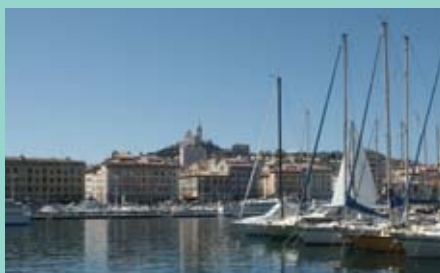
Marseille accueillera des experts présentant des visions, des moyens et des circonstances totalement différents.

Le symposium se tiendra au cours de l'année 2005, qui a été déclarée Année de la Méditerranée, à l'occasion du dixième anniversaire du processus de Barcelone, qui a pour but de partager une histoire et des traditions dans un espace méditerranéen commun de paix et de prospérité. Pour davantage d'information, voir la page web www.rehabimed.net , rehabimed@apabcn.es ou appeler au téléphone 93 393 37 70. ■