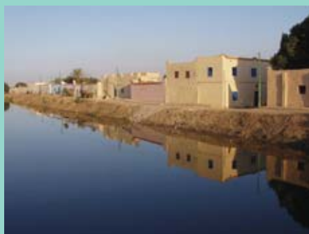
La NOUH a promu l'amélioration du paysage urbain dans l'un des canaux du Nil à Louxor.

Les techniciens de la NOUH tentent de respecter dans tous les projets l'environnement urbain et l'ambiance des sites, en plus de préserver les caractéristiques uniques des édifices antiques. Et ils travaillent pour améliorer l'espace urbain dans les villes égyptiennes en collaboration avec d'autres institutions de l'État égyptien. ■