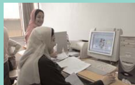
Deux collaboratrices de RehabiMed à l'université égyptienne.

Le réseau d'experts chargés d'élaborer une méthode pour la gestion de la réhabilitation urbaine est en train de commencer à préparer les instruments ainsi que les modèles de travail. Les experts chargés de rechercher la manière d'améliorer les travaux de réhabilitation des constructions traditionnelles de la Méditerranée travaillent de manière semblable. ■