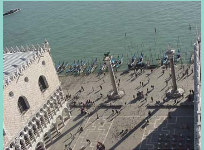
Venise est la principale référence internationale pour les professionnels de la restauration.

La réhabilitation. En 1975, impulsées par le Conseil de l'Europe, sont apparues la charte ainsi que la déclaration d'Amsterdam du patrimoine architectural. On envisageait alors la problématique de la dégradation physique et sociale des centres historiques, leur valeur patrimoniale ainsi que l'exigence d'adopter des mesures politiques pour leur réhabilitation. La nouveauté était basée sur le concept de conservation intégrée, ce qui, bien au-delà de la restauration des monuments, constituait une défense de la réhabilitation urbaine et envisageait des mesures d'équilibre social (protection de l'exode de la population, maintien du caractère de quartier, etc.). ■