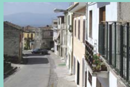
Un million d'euros des fonds régionaux ont été réservés pour l'amélioration des villages de la Campanie.

Le projet de loi Normes pour la sauvegarde et la revalorisation de l'architecture rurale traditionnelle envisage la protection de l'architecture rurale édifiée entre les XIII e et XIX e siècles sur le territoire de la Campanie (Italie). Cette réglementation de la Giunta Regionale della Campania ne s'écartera pas de la ligne suivie aussi bien par la Convention européenne du Paysage du 20 octobre 2000 que par la loi nationale de 2003 Disposizioni per la tutela e la valorizzazione dell'architettura rurale.